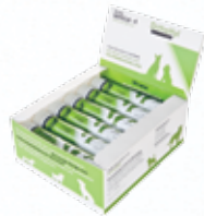
Vicano OrthoHyl SUPREME