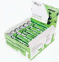
Vifelo OrthoHyl SUPREME